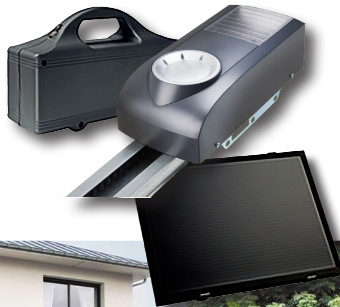
Schiebetore und Hoftore